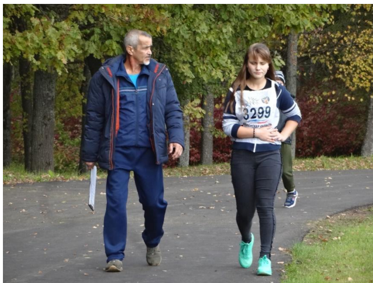
Участницы забега на 1000 метров