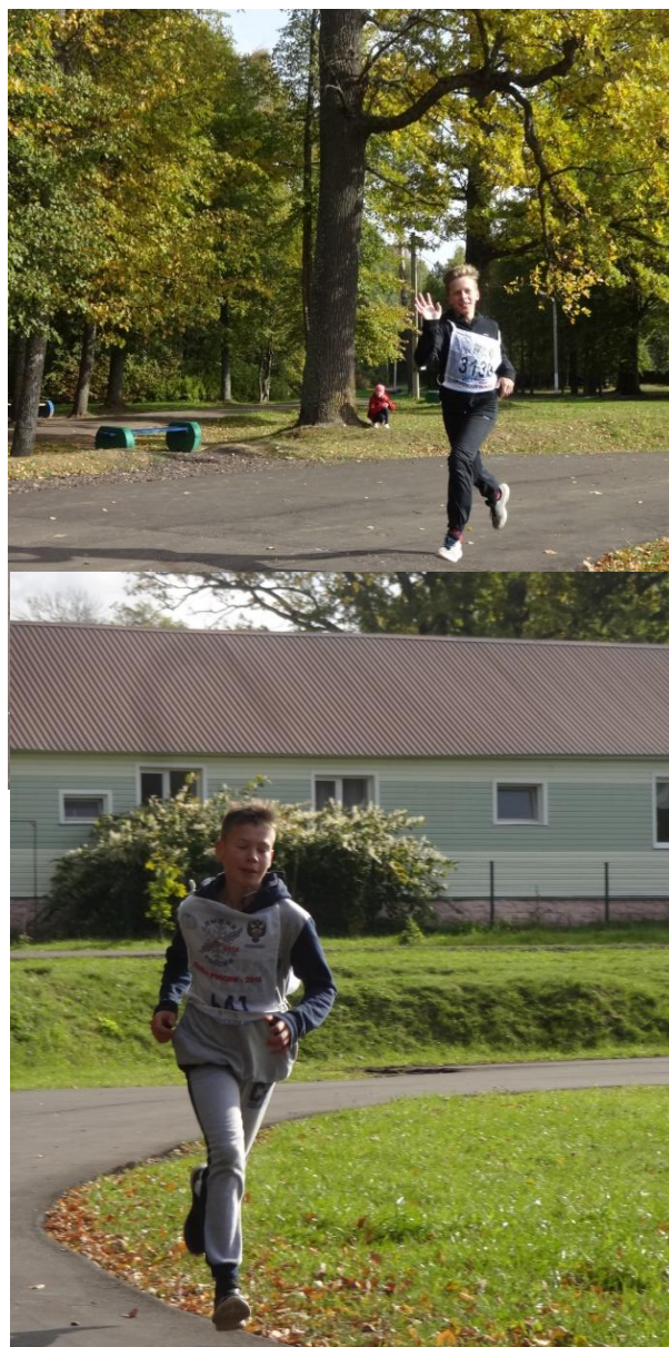
Участники забега на 1000 метров

Ребята старались показать хороший результат не только в личном, но и в командном зачете. Несмотря на дух соперничества, ребята дружно поддерживали одноклассников и встречали победителей овациями.