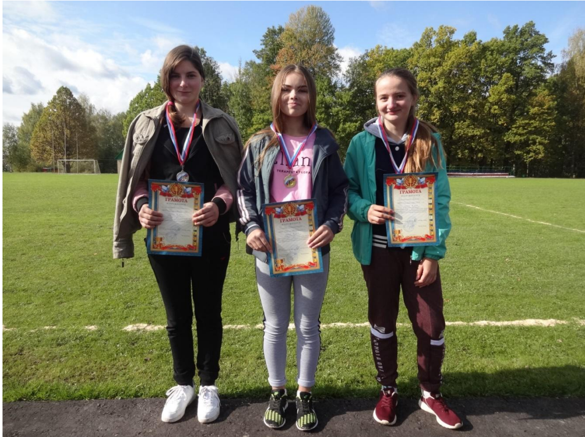
Победительницы на дистанции 1000 метров

На последней дистанции в старшей возрастной категории 2003 – 2005 г.р. юношам предстояло преодолеть дистанцию в 2000 метров. Участники кросса старались приложить все усилия и разбудить в себе второе дыхание, чтобы прибежать к финишной черте первыми. Нешуточная борьба развернулась на беговой дорожке среди старшего звена, каждый из ребят в ходе забега показал спортивное трудолюбие, упорство и желание победить.