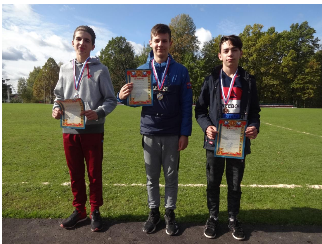
Победители на дистанции 2000 метров

Командное первенство в младшей возрастной группе распределилось следующим образом: