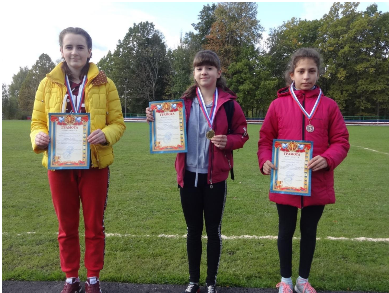
Победительницы на дистанции 500 метров

Бежать среднюю дистанцию на 1000 метров, которая входит в обязательную программу учебно-образовательных заведений, вышли самые выносливые мальчишки. Эта дистанция считается сложной именно потому, что здесь, при