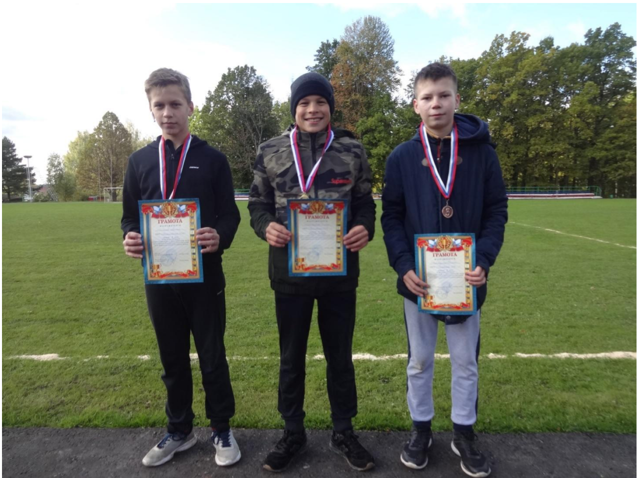
Победители на дистанции 1000 метров

В старшей возрастной категории 2003–2005 г.р. первыми на старт вышли красавицы-школьницы. Девушкам предстояло бежать дистанцию в 1000 метров. Скорее всего, как пробежать один километр, знают все, но если поставить цель пробежать за минимальное время, то можно сдаться, не достигнув и половины дистанции. Не у всех девушек в этот тёплый осенний денёк, получилось пересечь финишную черту.