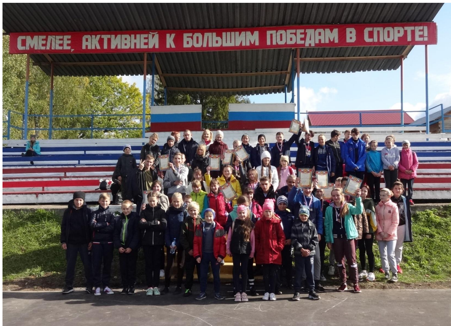
Участники легкоатлетического кросса-2019