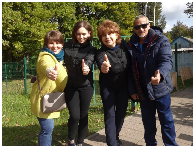
Судейская коллегия МБУДО «Холмовская ДЮСШ»

Поздравляем победителей, призёров и всех участников легкоатлетического кросса! Желаем успехов в спорте и всяческих побед в новом спортивном сезоне 2019-2020!