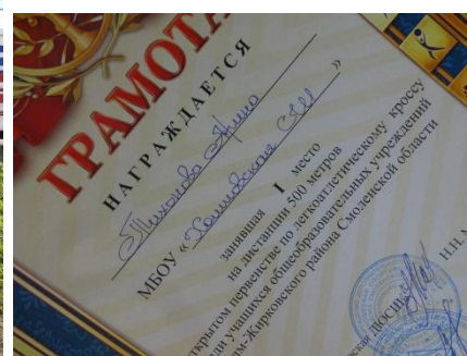
Команда МБОУ «Холмовская СШ»