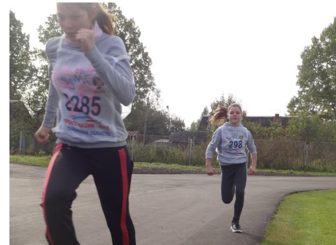
Участницы забега на 500 метров. Младшая возрастная группа.

Победительницами на дистанции 500 метров стали: